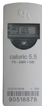
Q caloric 5.5 P3

Producent og ansøger: Qundis GmbH, Sonnentor 2, 99098 Erfurt, Tyskland