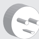
Dansk stikprop (med tre ben)