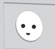
Dansk stikkontakt med jordforbindelse