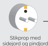
Stikprop med sidejord og pindjord

Hvis du heller vil skifte stikket på dit apparat, kan du selv gøre det – det kræver ingen autorisation.