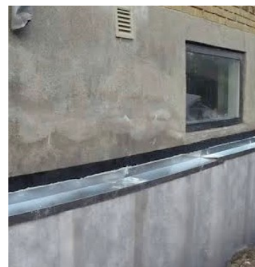
Afdækning af udvendigt isolerede kælderydervægge med inddækningsblik og geotekstil mod terræn.