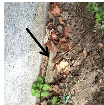
Udvendigt isoleret kælder. Der mangler en afdækning af isoleringen – se sort pil.