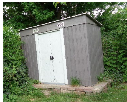
4. Simpelt stålpladeskur