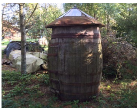
9. Et sjøvt baderum