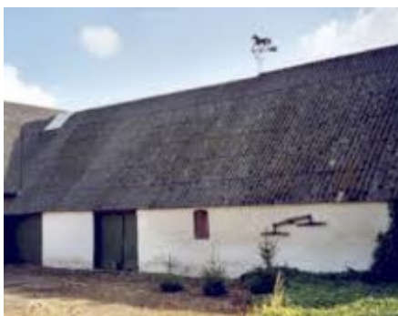
25. Ingen stabilitet og uden restværdi (risiko for kollaps af hvælvinger, revner i vægge)