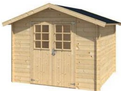
13. Mindre skur/udhus

Nedenstående illustrerer bygningslignende konstruktioner mellem 5 m 2 og 10 m 2 , der kan undtages fra bygningseftersynet, dvs. de indskrives i tilstandsrapporten, men de skal ikke undersøges.