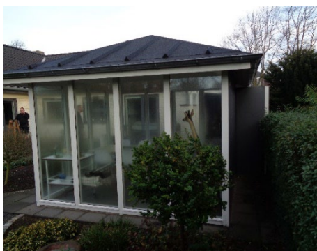
21. Udestue (isoleret)