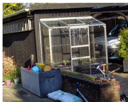
8. Et lille drivhus