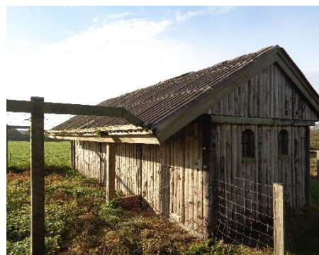
12. Simpelt dyreskur