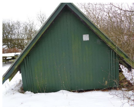
16. Mindre skur/udhus