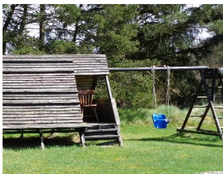
3. Legeborg/legehus (haveinventar)