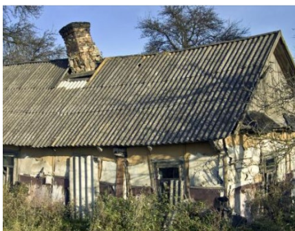
29. Ingen stabilitet og uden restværdi