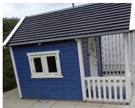
10. Et legehus