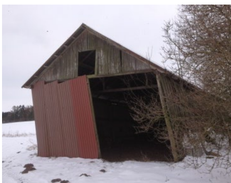
23. Ingen stabilitet og uden restværdi.

Eksempler på bygninger, som kan undtages fra eftersynet grundet ringe byggeteknisk værdi