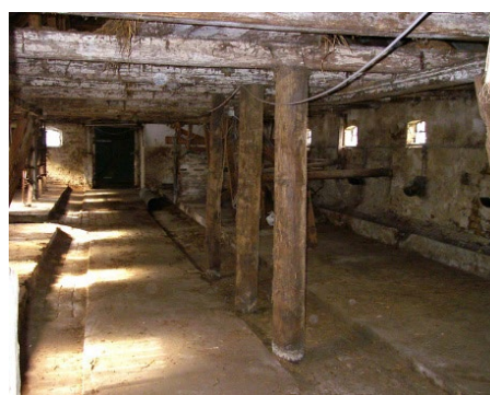
28. Råd og insektskader (gl. indretning med uens gulve)