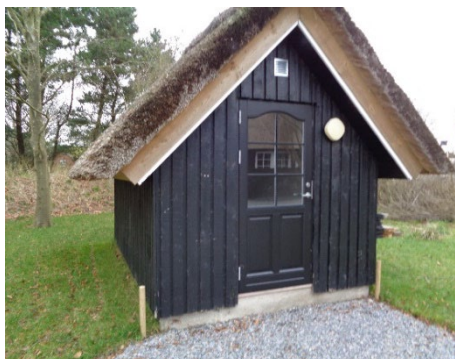
17. Anneks (isoleret)

Nedenstående illustrerer bygninger mellem 5 m 2 og 10 m 2 , der grundet en skønnet indkøbsværdi (uden opstilling og montage) på mere end ca 10.000 kr. skal indgå i bygningseftersynet.