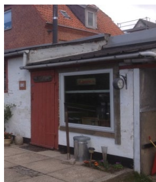
24. Omfattende nedbrydning (skader i tag, råd i vægge).