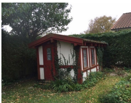
15. Mindre udhus