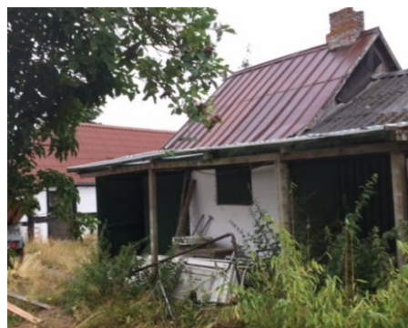
26. Ingen stabilitet og uden restværdi (risiko for svigt i lofter/etager, revner i vægge )