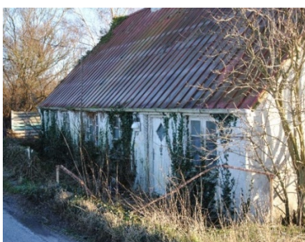
27. Nedslidt. Huller i tag og ingen varme